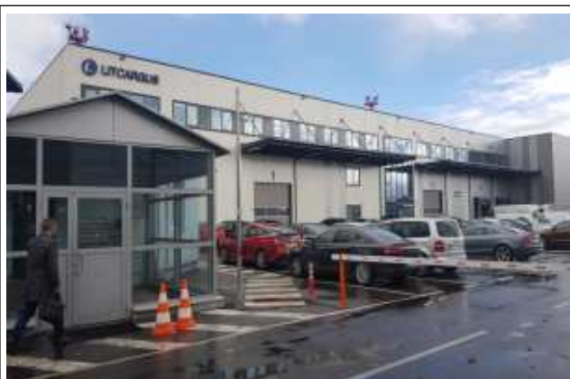
빌니우스 MRO 입구 검문소