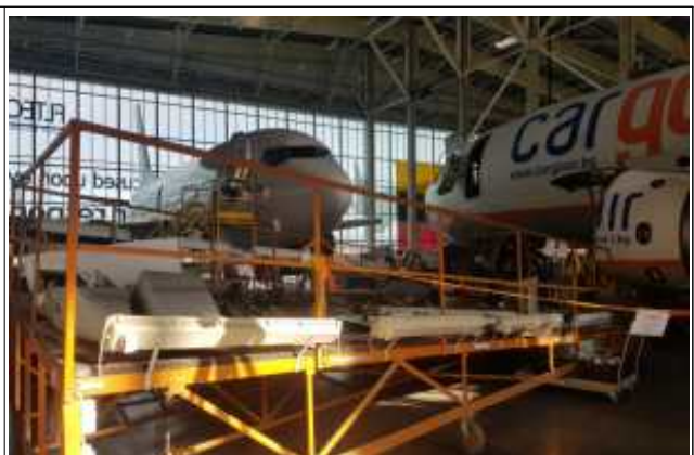
빌니우스 MRO 내부