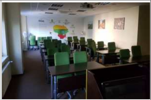
빌니우스 MRO 교육실