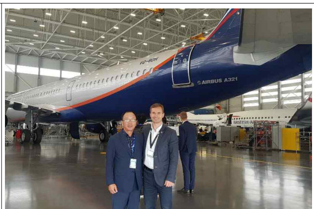
카우나스 MRO 내부