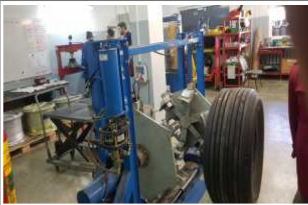
빌니우스 MRO 정비실