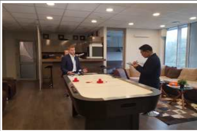
카우나스 MRO 인터뷰