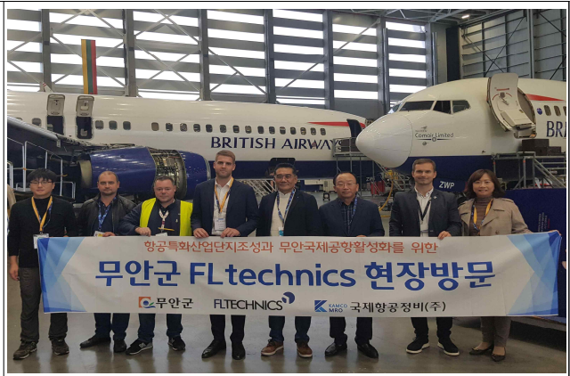
카우나스 MRO 방문 기념