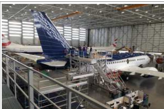
카우나스 MRO 내부