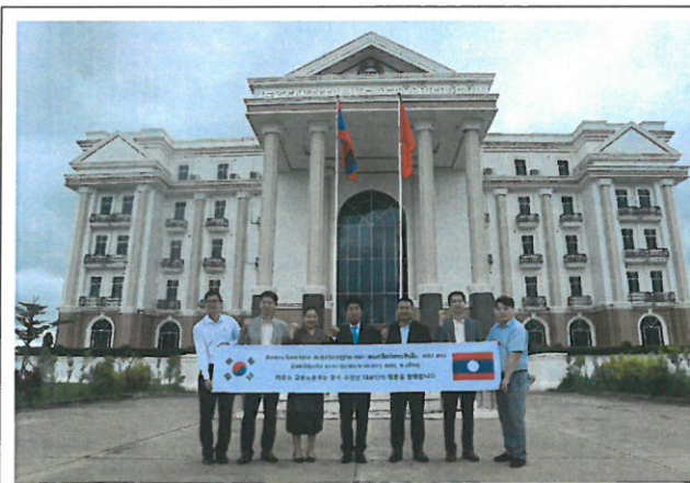
[라오스 고용노동부 방문]