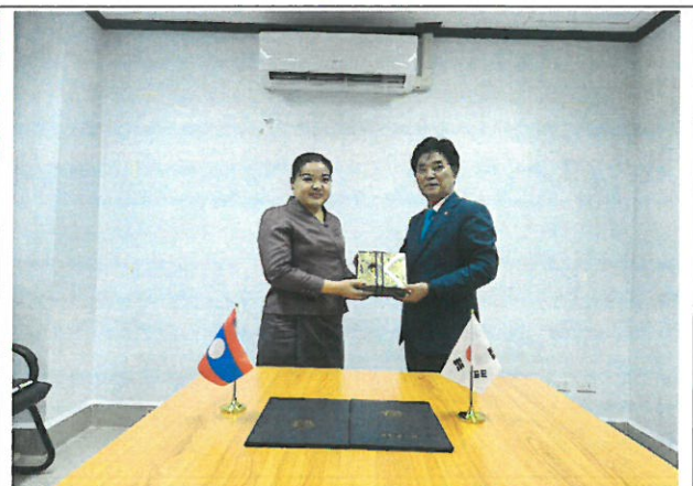
[의장님 · 라오스 노동부 국장 기념 촬영]