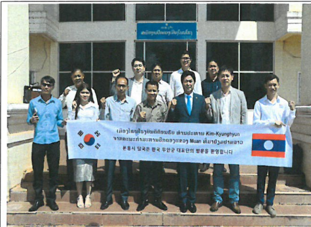
[폰홍군청 방문 사진]