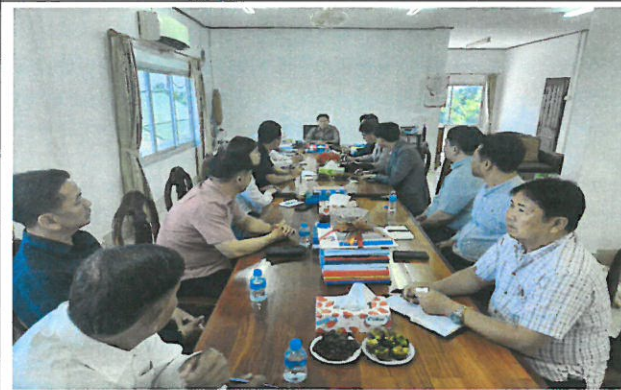
[폰홍군청 업무협의 사진1]