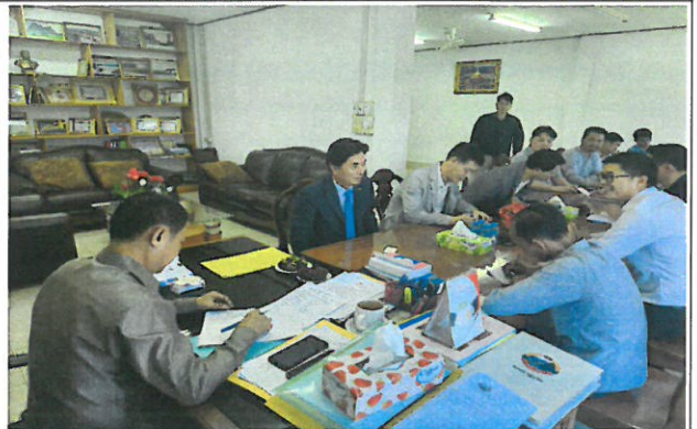
[폰홍군청 업무협의 사진2]