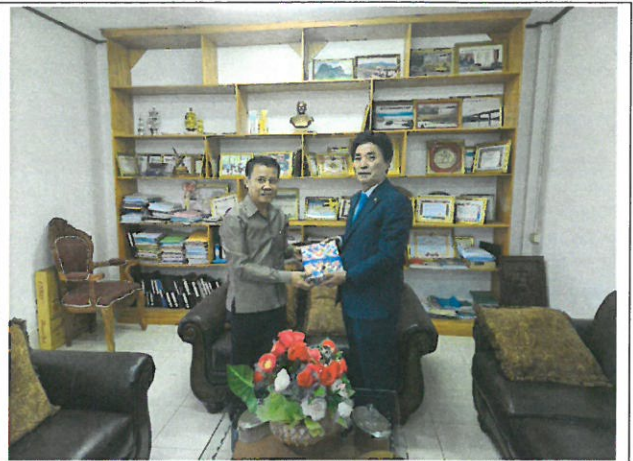
[의장님 · 폰홍군수 기념 촬영]