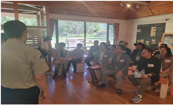
세계유산센터 브리핑 청취