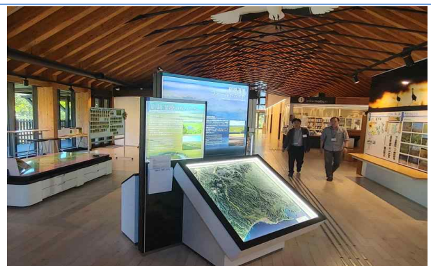
내부 전시시설 전경