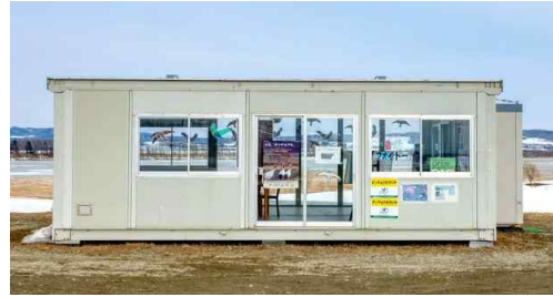
새의 역 '마오이토'