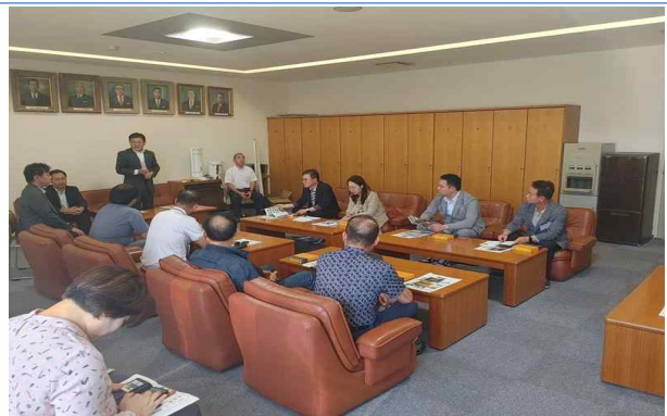
브리핑 청취 및 질의 응답