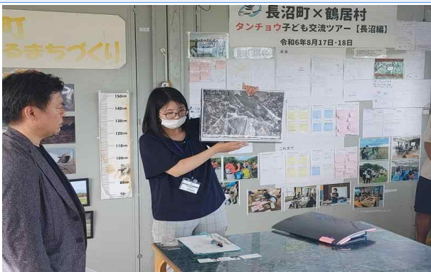
브리핑 청취 및 질의 응답