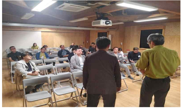
자연센터 브리핑 청취