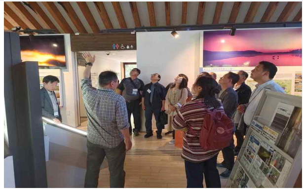
내부 관람시설 브리핑 청취