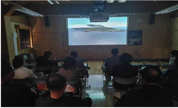
자연센터 안내영상 시청