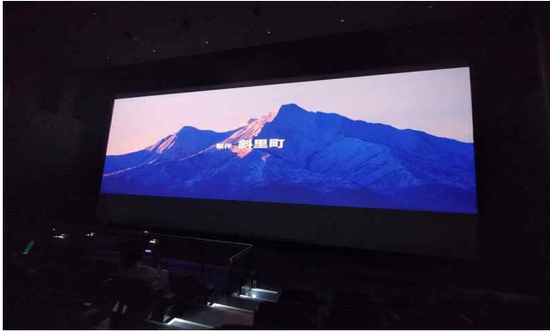
세계유산센터 홍보 영상 시청