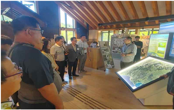
내부 관람시설 브리핑 청취