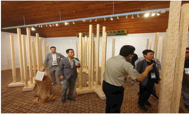
땅 100평방미터갓기 특별관 관람