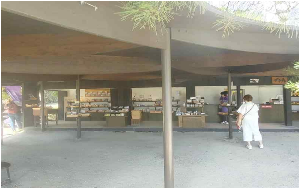
야외 기념품 판매점