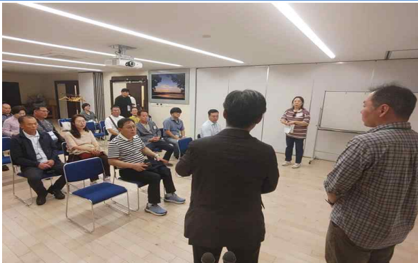
관리운영 현황 브리핑 및 질의응답