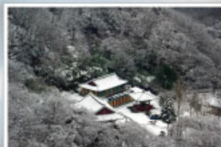
법 천 사

송달산에 위치하여 등산객들과 암자를 찾는 이들에게 휴식처이자, 정제된 공간으로서 장소를 제공하고 있다. 주변에는 영산강, 끝 없이 펼쳐지는 다도해가 장관을 이루고 있어 또다른 즐거움을 준다. 암자인 묵우암 경내에는 법당 및 요사채, 축성각, 석등 부도가 있으며 법당 안에 봉안되어 있는 삼존불은 지불로써 현재 문화재 자료 제172호로 지정 관리되고 있다.