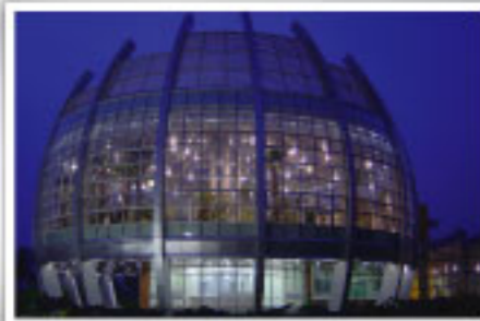
회산백련지 내 수상유리온실

전국에서도 백련은 극히 희귀할 뿐 아니라 동양 최대의 규모(383,383㎡)를 자랑하고 있다. 지난 13년 동안 무안백련축제는 지역의 대표적인 축제로 자리매김하였으며 2008년부터 무안 '대한민국 연 산업축제'로 명칭을 변경하여 매년 7월~8월 사이에 개최된다. 이는 연꽃을 관람하는 차원을 넘어서 연을 산업화하는 선도자로서 자리매김을 할 것이다.