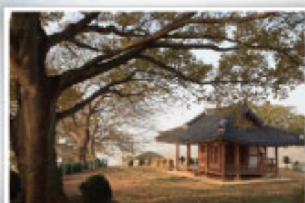
식 영 정

한호 임연 선생이 1630년 무안에 입향한 이후 강학 소요처로써 굽이쳐 흐르는 영산강과 그 주변경관이 잘 어울려 당시 많은 시인묵객들이 즐겨찾은 곳이었다. 강학교류의 장소로서 활용되었던 식영정은 '그림자가 쉬어가는 정자'라는 뜻으로 드넓게 펼쳐진 영산강 유역의 대표적인 정자이며 주변경관이 뛰어나 많은 사람들이 찾는 곳이다.