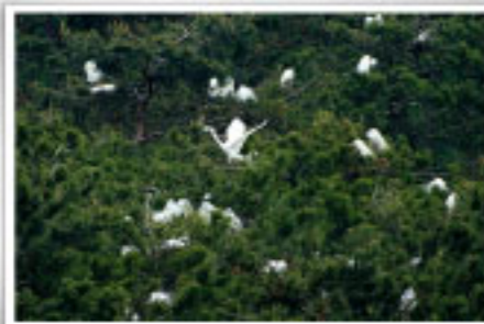
백로 및 왜가리 번식지(천연기념물 제211호)